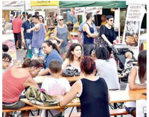
Street food protagonista nelle strade del centro